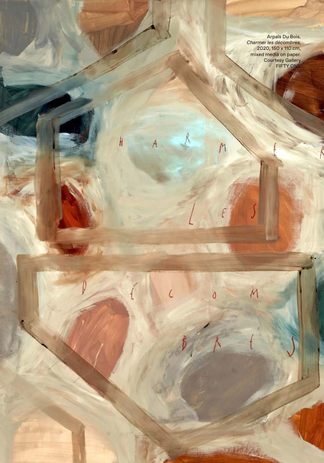
Arpaïs Du Bois. Charmer les décombres , 2020, 150 x 110 cm, mixed media on paper.