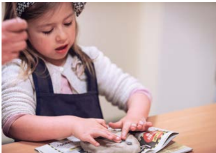
01. Matières, formes, volumes. Bas-relief en terre

Durée (visite + atelier) : 2h Coût: 3€ par élève