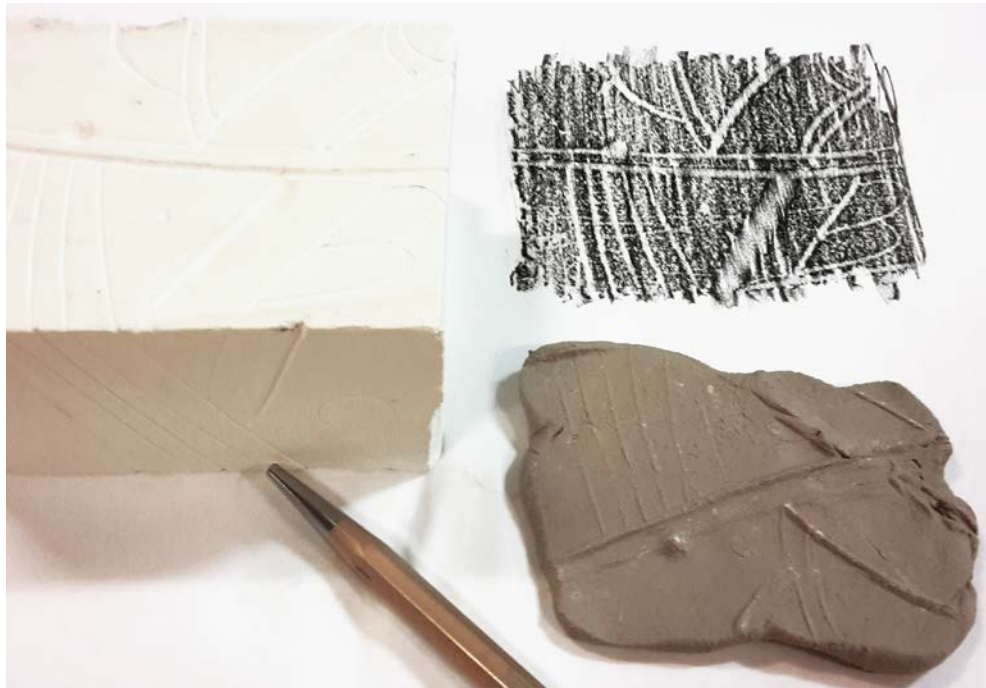
05. Graver le volume — Plâtre / Terre / Papier

Durée (visite + atelier): 2h Coût: 3€ par élève A partir de 7 ans