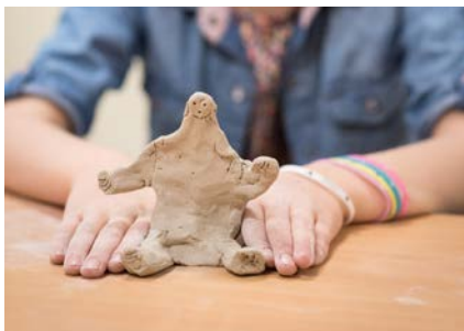
01. Matière & volumes